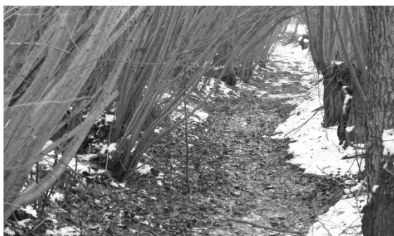
Rund 300 Meter Bachlauf wurde instand gestellt.

Aufgrund der bundesrechtlichen Vorgaben wurde das Mandat für den Nachführungsgeometer öffentlich ausgeschrieben. Unter Berücksichtigung des Zuschlagskriteriums wurde das wirtschaftlich günstigste Angebot ausgewählt und das Nachführungsmandat der amtlichen Vermessung (2018 bis 2025) an die W+H AG, Ingenieure, Herzogenbuchsee/Biberist, erteilt.