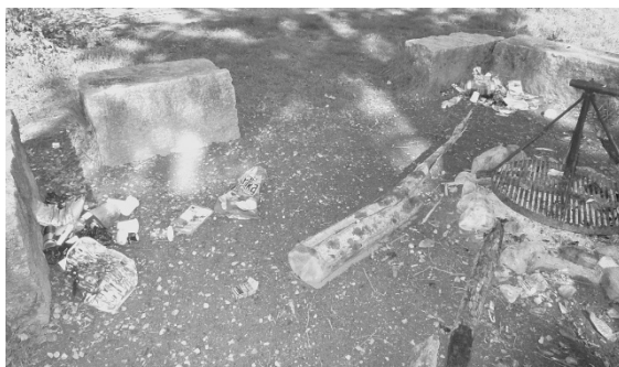
Die Benutzenden der «Brätstellen» hinterliessen nicht immer Ordnung.

Leider gab es auch weniger schöne Arbeiten zu erledigen. Zum Beispiel das Aufräumen bei den «Brätstellen» oder das Aufstellen von ausgerissenen Verkehrsschildern.