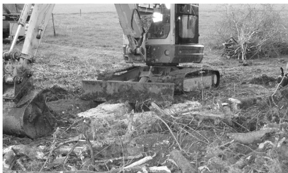
Teile der Arbeiten konnten mit dem Bagger erledigt werden.

Da die Gebührenerträge im Abfallbereich die Aufwände seit Jahren nicht mehr zu decken vermochten und in der Rechnung 2016 erstmals ein Bilanzfehlbetrag entstand, mussten die Abfallgebühren angepasst werden. Der Gemeinderat setzte die Gebühren innerhalb des im Abfallreglement 2014 definierten Gebührenrahmens fest und erliess dazu eine neue Abfallgebührenverordnung.