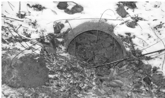
Es musste viel Schlamm entfernt werden.

Der Verkehrsrichtplan der Gemeinde sah als Massnahme die Erstellung eines Fussweges entlang der Waldstrasse vom Zentrum Mösli bis zum Kreuzungsbereich Fuss-/Radweg Bahnhof-Landshutstrasse vor. Der Gemeinderat beschloss im Oktober für den Neubau des Fussweges einen Verpflichtungskredit von CHF 244'000.