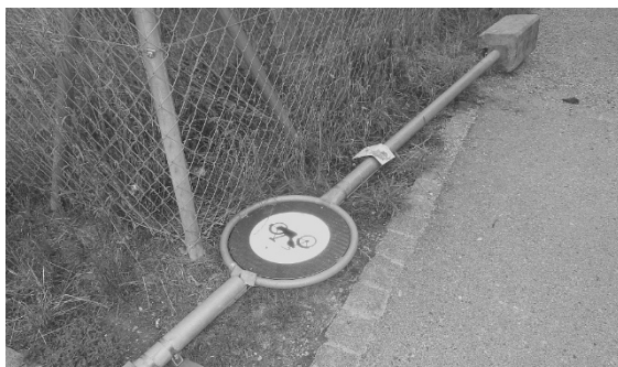
Ausgerissene Verkehrsschilder mussten wieder positioniert werden.