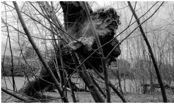
Wurzefällnis der Eschen.