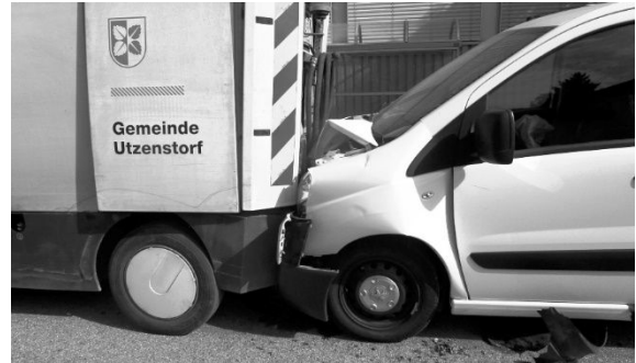
Unfall mit der Reinigungsmaschine MFH.

In Zusammenarbeit mit dem Zivilschutz wurden am Grundbach die Arbeiten der Uferpflege ausgeführt.