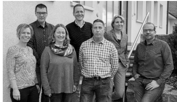
Gemeinderat Utzenstorf, Legislatur 2020–2023.

Der Gemeinderat beschäftigte sich unter anderem mit folgenden Hauptthemen: