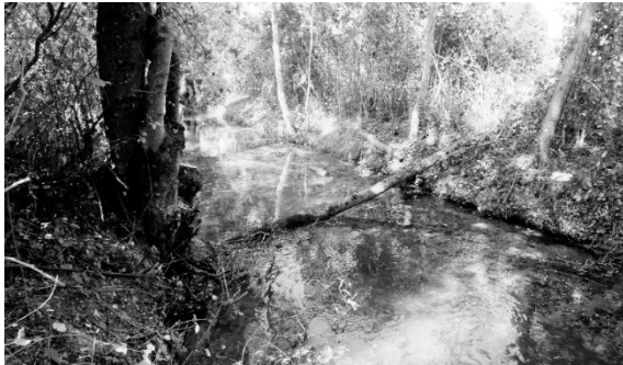
Uferpflege des Grundbachs.