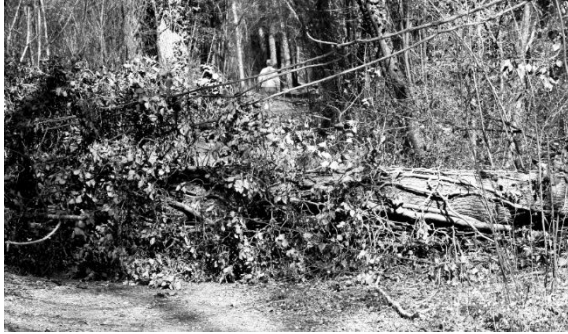
Eine Esche fiel auf den Weg.