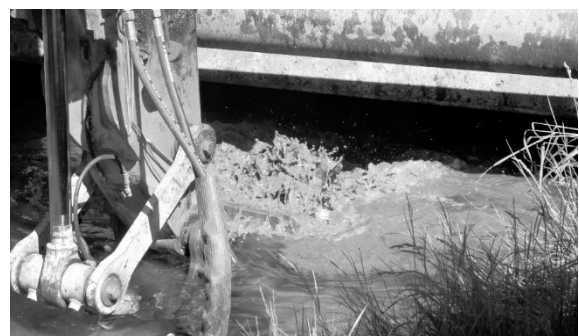
Behabung des Rückstaus mithilfe eines Baggers.