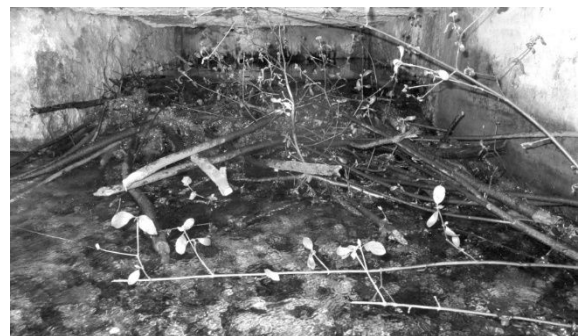
Laub und Gehölz im Vereinsbach.